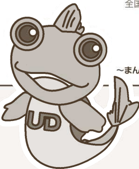
佐賀県UDキャラクター ゆうちゃん