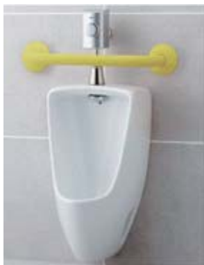
④男児用小便器 〔女子トイレ〕