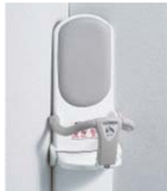
⑨全個室にベビーキープ

※本アンケートは無記名アンケートです。ご回答いただきました内容は、アンケートの趣旨・目的以外の目的には使用いたしません。