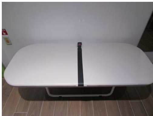
⑤ユニバーサルシート 〔多目的〕