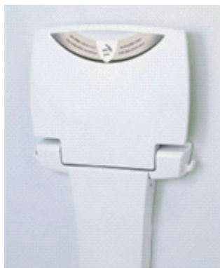
②ベビーシート 〔男女簡易多目的〕