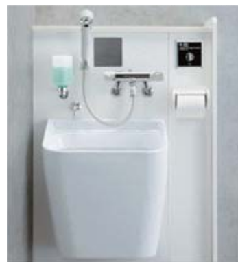
③オストメイト対応設備 〔多目的〕