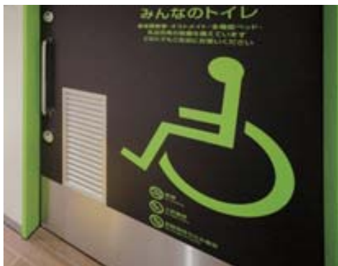
①大きくてわかりやすい案内標示