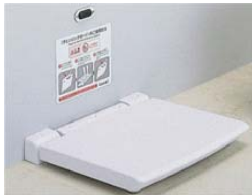
⑥チェンジングボード（着替え台） 〔男女簡易多目的〕