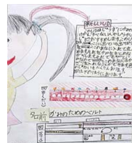
平成25年度 知事賞受賞作品 （アイデア作品の部）

※詳しくは、「さがUDラボ」 http://www.saga-ud.jp/ をご覧ください。