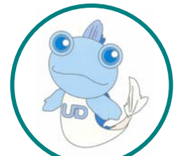
佐賀県UDキャラクター ゆうちゃん